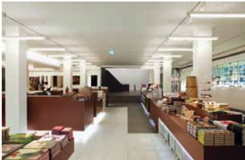
Atelier in de Hermitage voor Kinderen