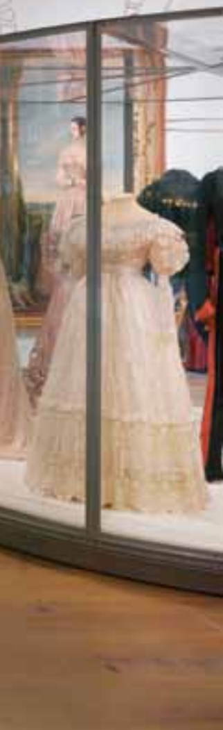
FOTO LINKS De vitrines in de grote zaal draaien iedere 20 minuten rond

een laat-hollands classicistische bouwstijl: sober, met een zeer regelmatige plattegrond. De binnentuin, door Merkx betiteld als 'mooiste huiskamer van Amsterdam' en ingericht door landschapsarchitect Michael van Gessel, wordt omsloten door een vierkant van 102 x 102 m bestaand uit de westvleugel aan de Amstel, de twee expositievleugels en de tuinvleugel, waarin zich het entreegebied bevindt. Bezoekers komen binnen via de Ossenpoort aan de Amstelzijde - door Van Heeswijk uitgediept om een royale entree mogelijk te maken - en wandelen vervolgens via de binnentuin naar de foyer.